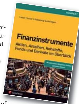
Finanzinstrumente – Aktien, Anleihen, Rohstoffe, Fonds und Derivate im Überblick, Verlag LexisNexis Österreich, 254 Seiten, ISBN 9783700756880, € 49,00

Seit Ausbruch der Finanzkrise wurden der Kapitalmarkt und die Spekulation mit Finanzinstrumenten in Politik und Medien intensiv und meist polarisierend dargestellt. Durch das rasante Wachstum der Finanzindustrie und ihre enge Verknüpfung mit anderen Branchen haben Finanzinstrumente einen steigenden Einfluss auf Unternehmen auch außerhalb des Finanzsektors sowie auf Privatpersonen gewonnen. Aktien, Anleihen, Währungen, Rohstoffe, Investmentfonds und Derivate sind mittlerweile allgegenwärtige Begriffe, die dem Leser täglich in verschiedensten Medien begegnen. Dieses Fachbuch bietet eine zusammengefasste und praxisorientierte Einführung in Finanzinstrumente. Es verschafft einen kompakten und systematischen Überblick über dieses Thema und erläutert die verschiedenen Gruppen von Finanzinstrumenten anhand von Beispielen. Ein Glossar, Praxisbeispiele und Grafiken runden das Werk ab.